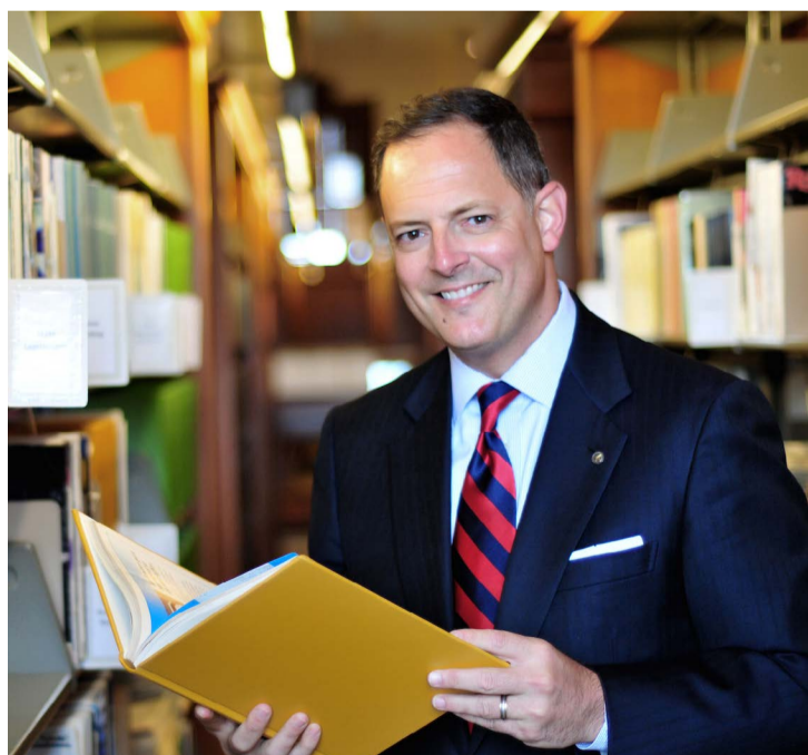
Ông Rafael Anchia - Đại biểu Bang Texas