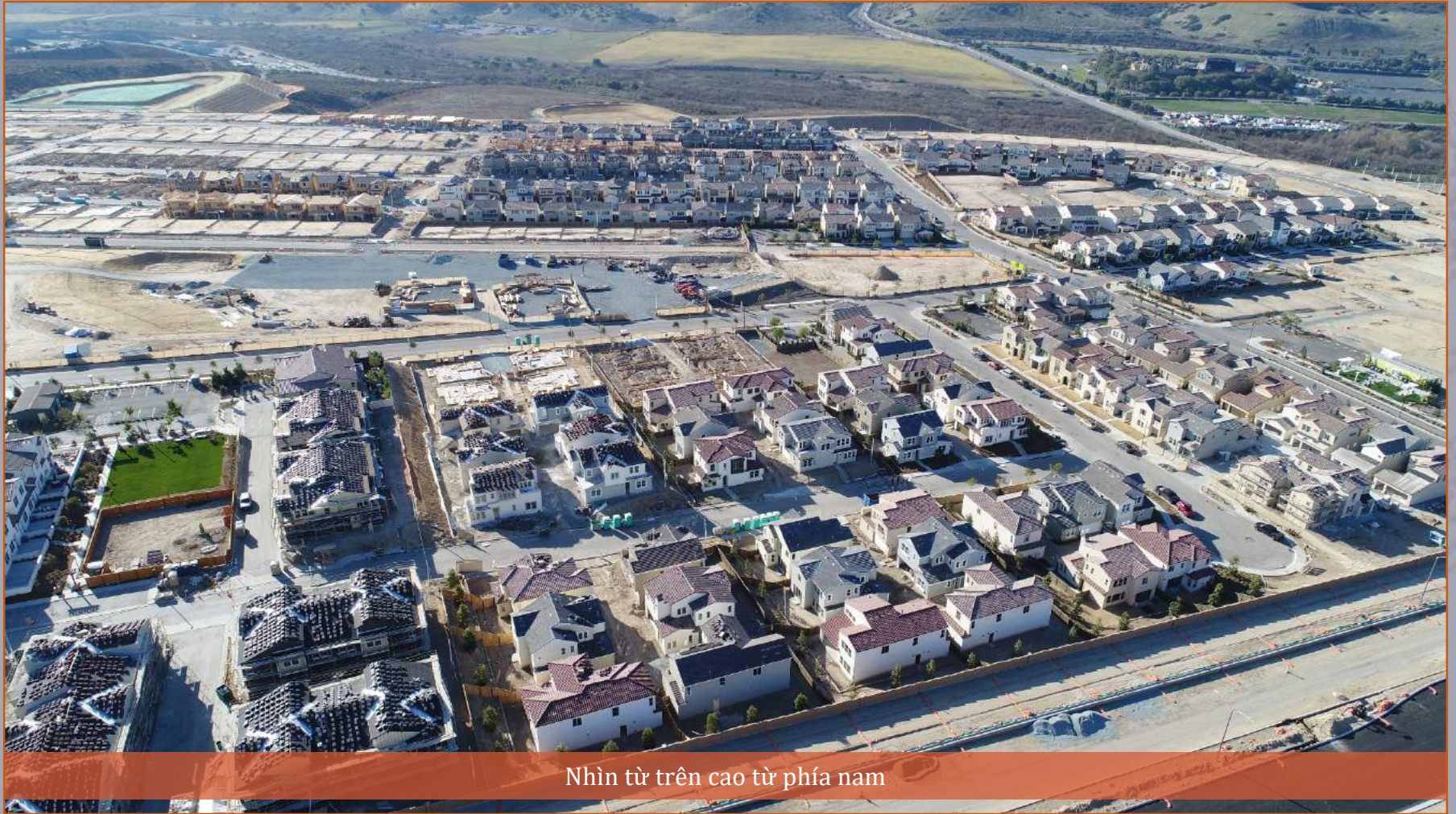
Nhìn từ trên cao từ phía nam