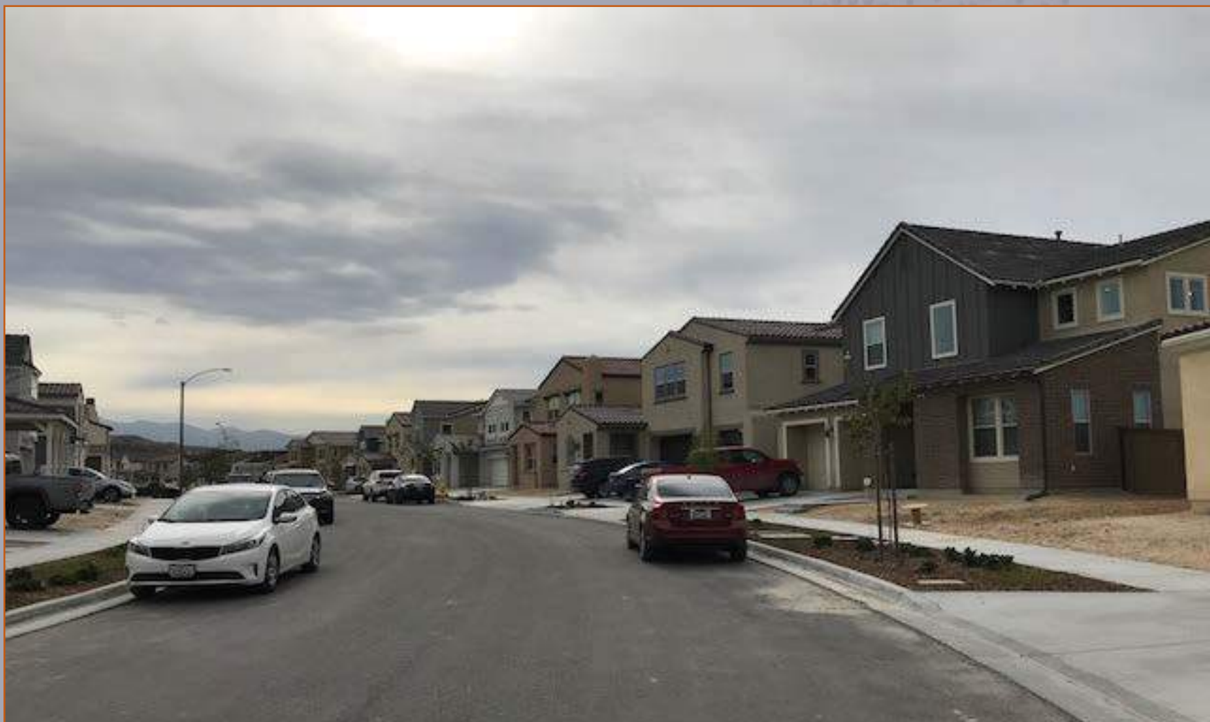
Khu phố đã hoàn thành cho cư dân chuẩn bị vào ở