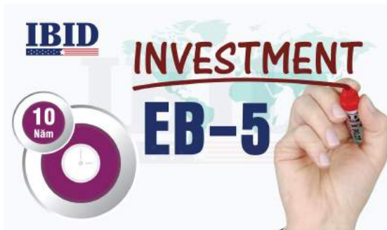
Chương trình đầu tư EB-5 định cư Mỹ

Khẳng định vị trí của mình trên thị trường EB-5 Việt Nam, công ty tư vấn IBID cam kết lộ trình 10 năm đi cùng nhà đầu tư cho đến khi nhận được hoàn vốn từ dự án.